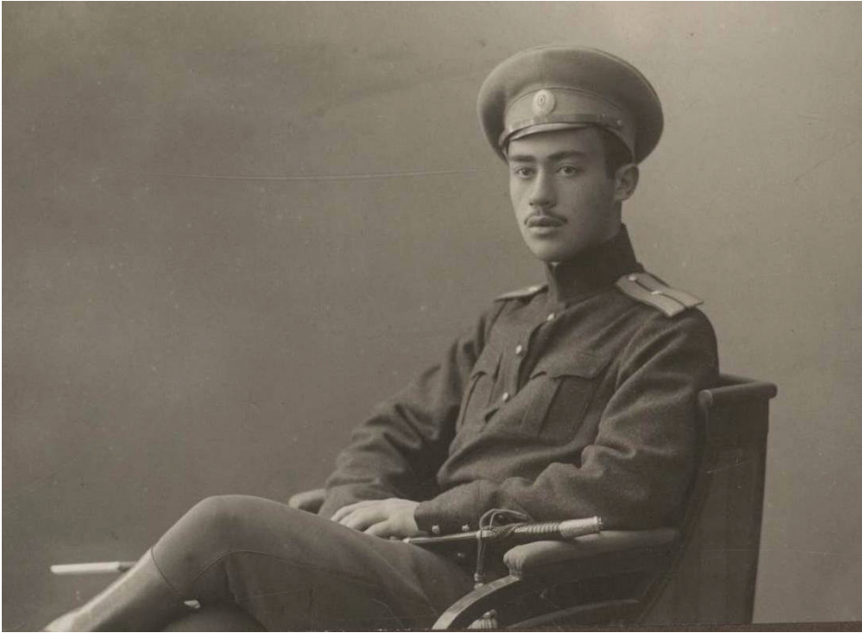
ვლადიმერ ბარნაბიშვილი - აირუმის ბრძოლაში დაღუპული ახალგაზრდა ოფიცერი. Vladimer Barnabishvili - a young officer killed in the battle of Ayrum.