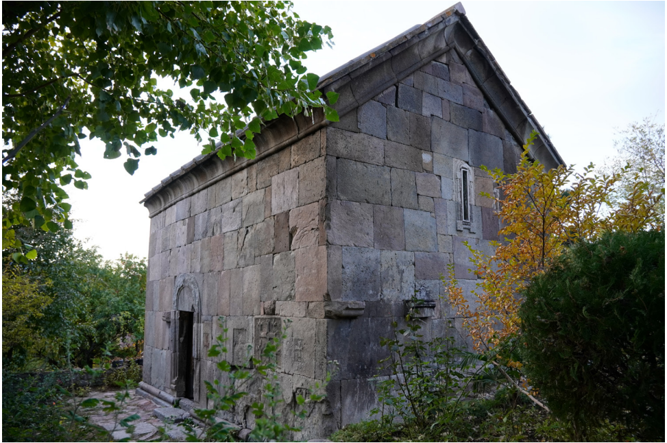
(სურ. 4) უდეს წმიდა ნინოს ეკლესია

ფარსმანი X საუკუნის მინურულში მოღვაწე ფარმან ერისთავთან გააიგივა და, ლელა შანიძის მსგავსად, წარწერის ქრონოლოგია X-XI საუკუნეების მიჯნით განსაზღვრა.