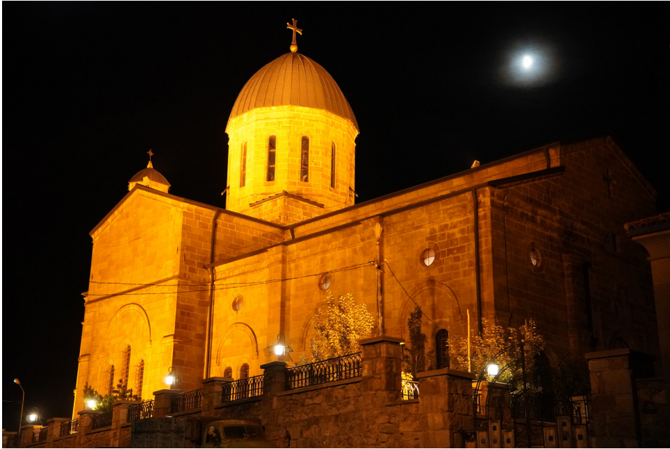
(სურ. 1) უდეს ღმრთისმშობლის ეკლესია

დაიწყო XX საუკუნის დასაწყისში კათოლიკეების მიერ შელესილმა ფენამ. ამის შედეგად ეკლესიის ჩრდილოეთ კედლის ერთ-ერთ სვეტის ძირში გამოჩნდა წარწერიანი ქვა, რომელსაც აშკარად ეტყობოდა, რომ მეორადი დანიშნულებით იყო გამოყენებული. 1