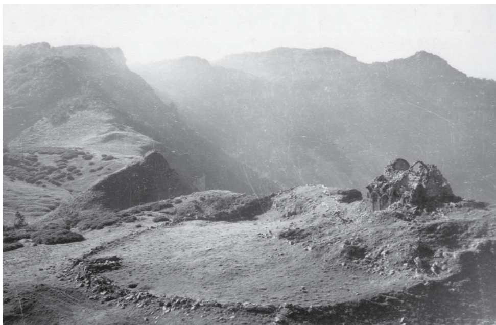
სურ. 1. მთის წმ. გიორგის მონასტერი (მ. დვალის ფოტო, 1954 წ. ინახება საქართველოს კულტურული მემკვიდრეობის ძეგლთა დაცვის ეროვნული სააგენტოს დოკუმენტთა საცავში)